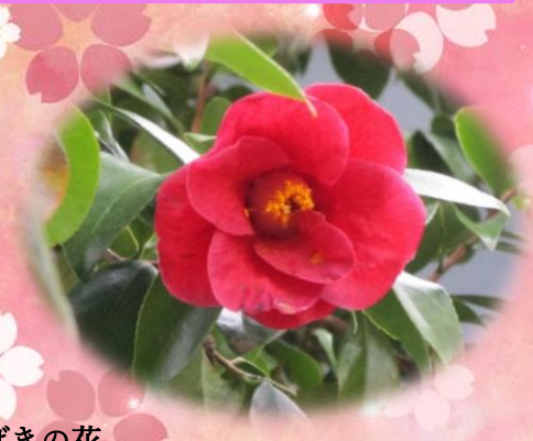
椿峰分館入口付近に咲いたつばきの花