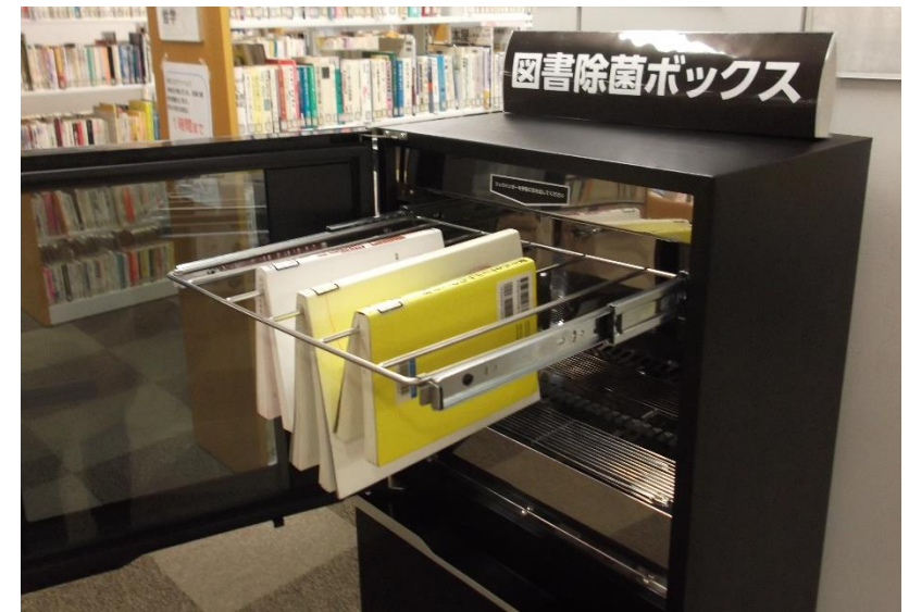
〈図書除菌ボックス〉