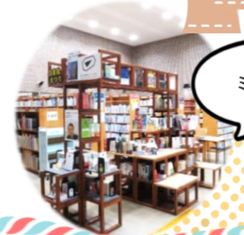
角川武蔵野ミュージアム 書棚展示