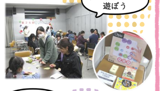
ボードゲームで遊ぼう