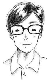
排架ボランティア T・Yさん