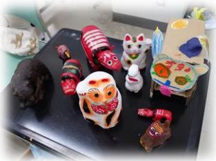
モデルとなった郷土玩具の数々