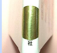
金シール 季節・行事