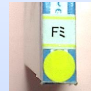
F (黄シール AF) やさしい物語