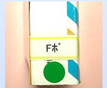
F (緑シール YF) ティーン向け物語