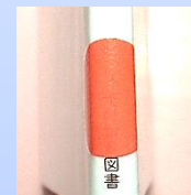
桃シール 赤ちゃん向け