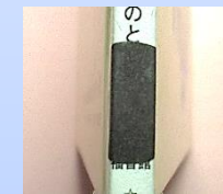
黒シール おばけ・魔法使い