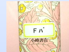
F (シールなし) 物語